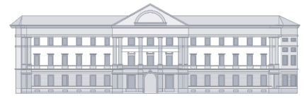
Palazzo Serbelloni Immobiliare